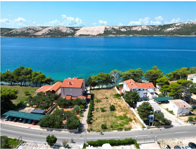
Drohnenaufnahme Blick auf das Meer