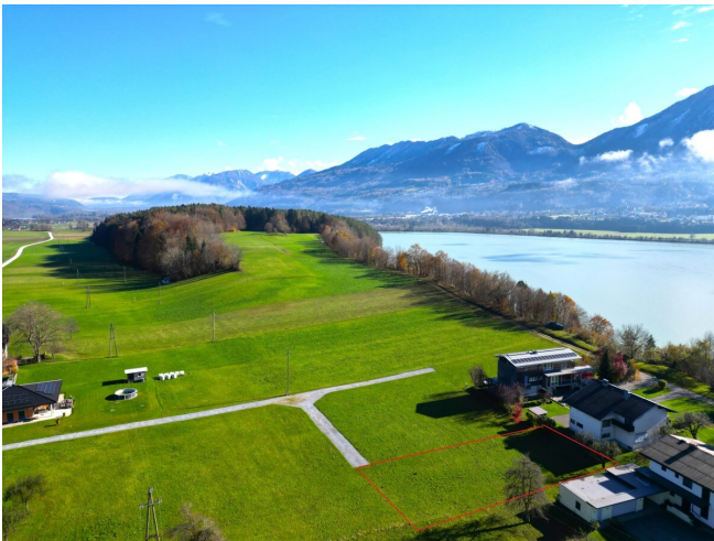
Blick nach Westen