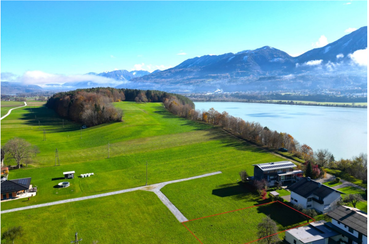
Blick nach Westen